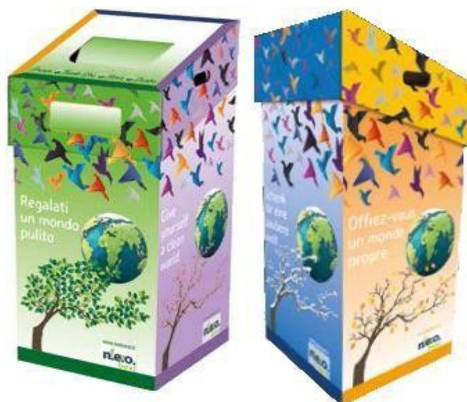
CONTENITORI IN CARTONE PER RACCOLTA DIFFERENZIATA LT.90